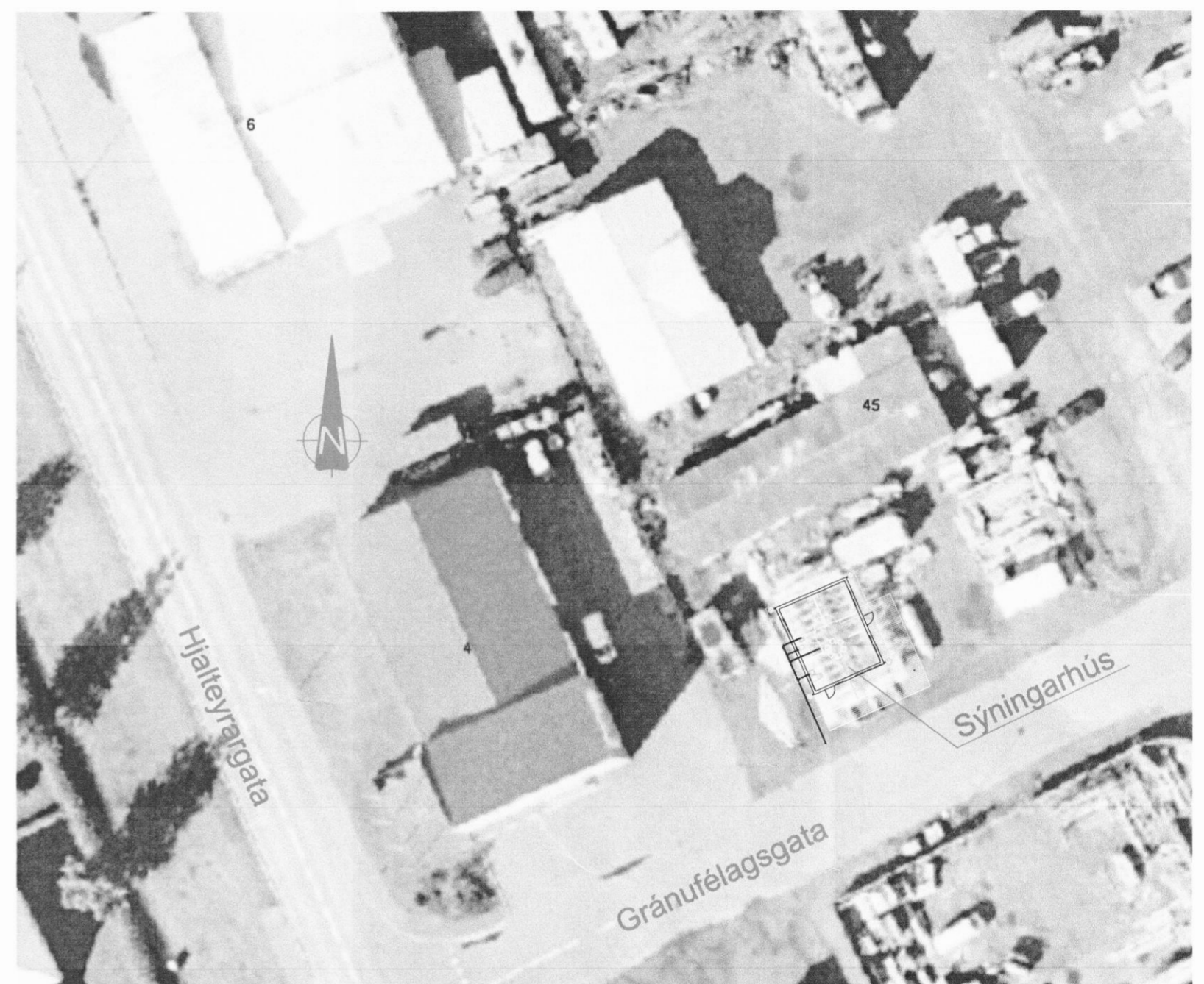
Afstöðumynd Mkv. 1:500