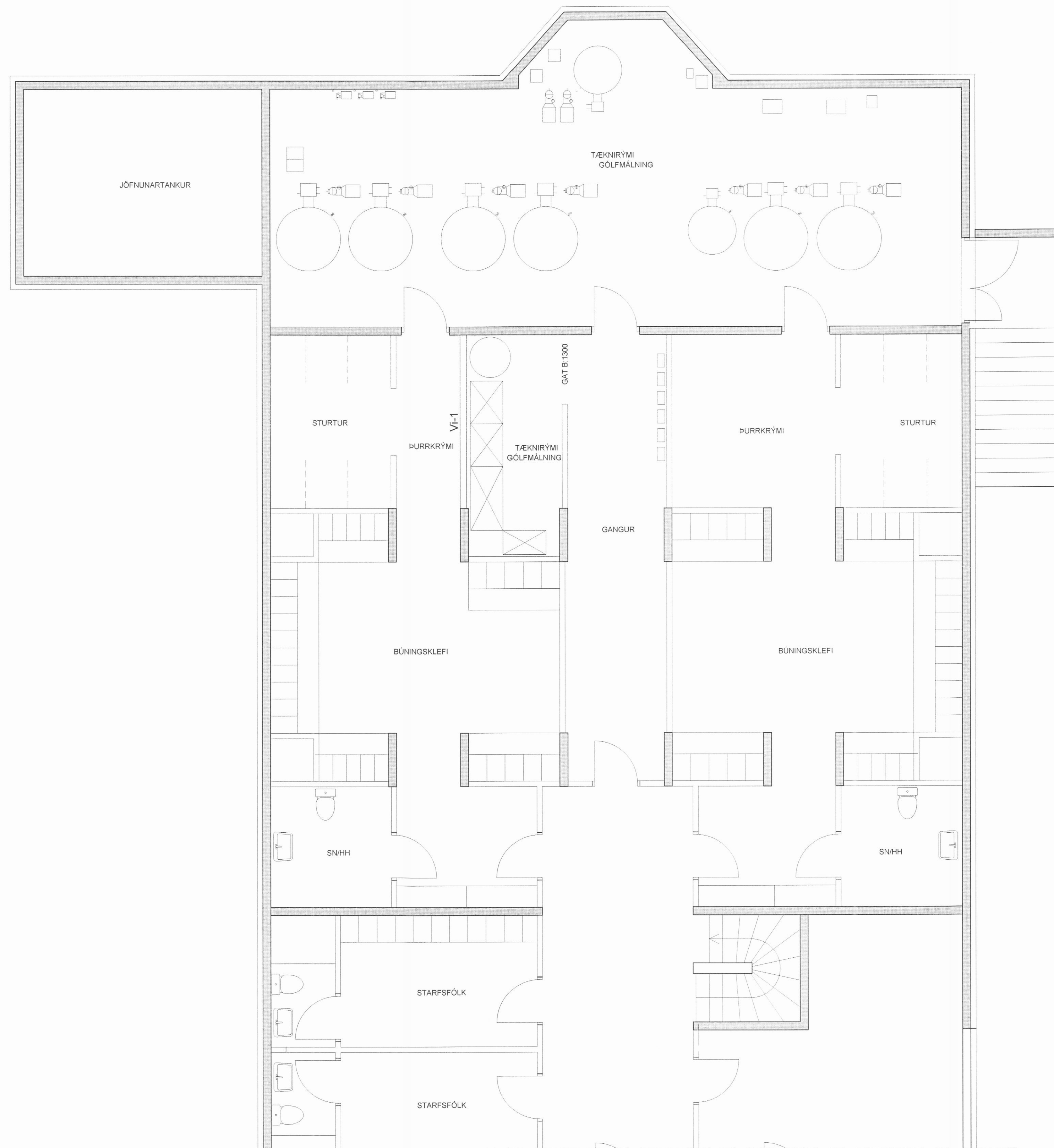
GRUNNMYND M. 1:50 @A1