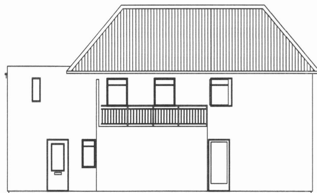
Útlit vesturhlíð 1:100