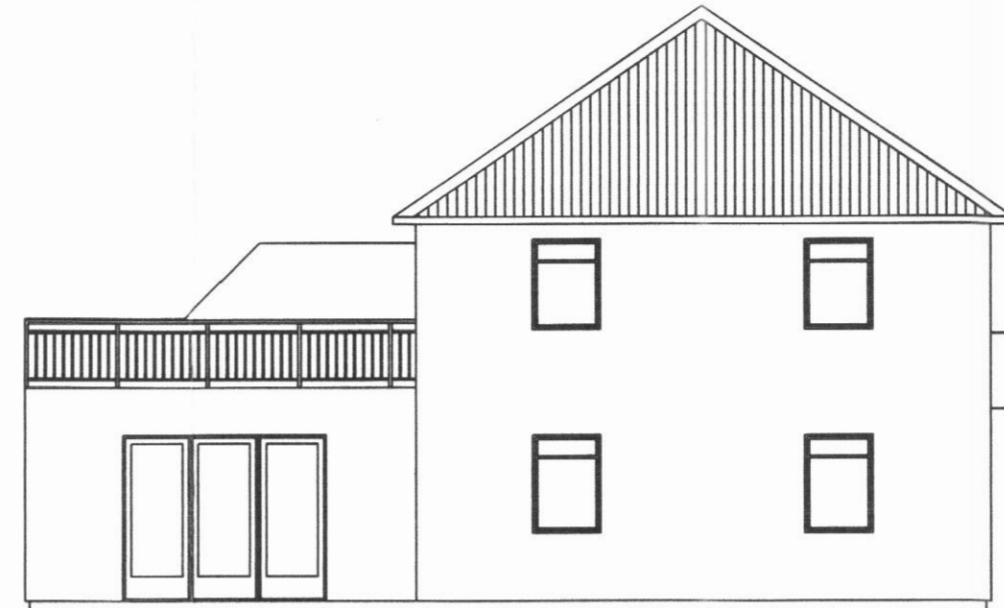
Útlit suðurhlíð 1:100