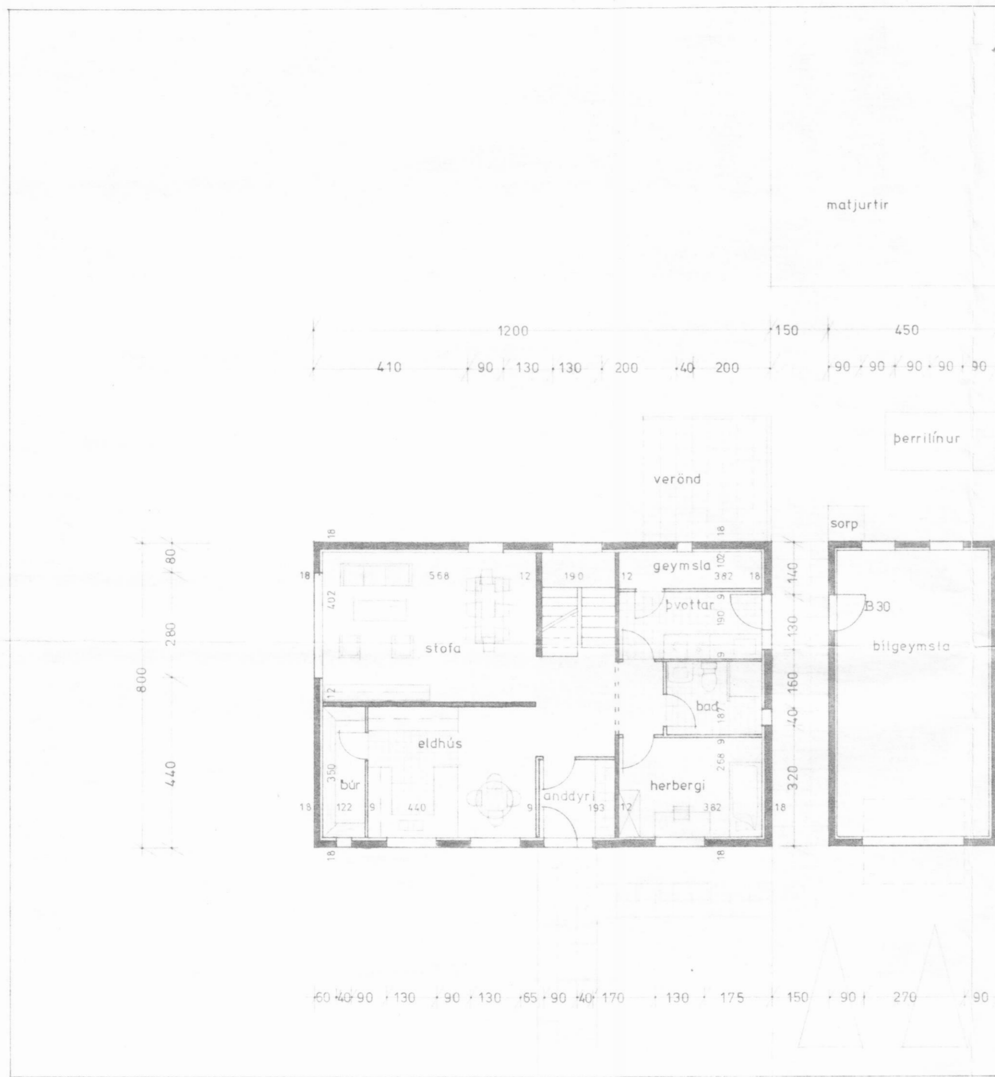
GRUNNMYND 1. HÆÐAR MKV. 1:100