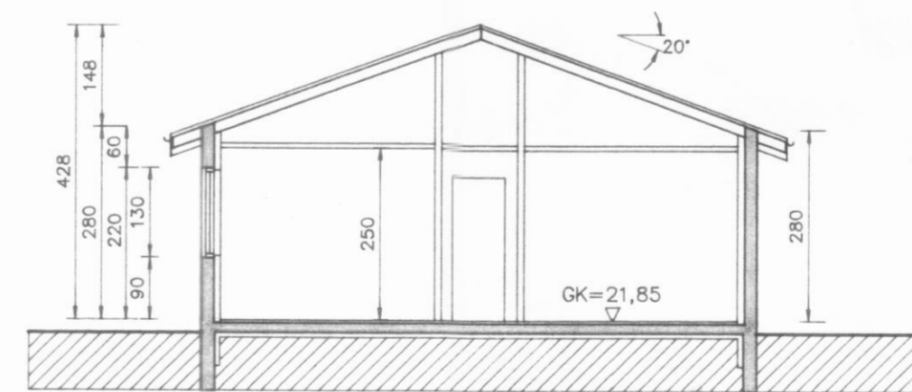
Snið B-B Mkv. 1:100