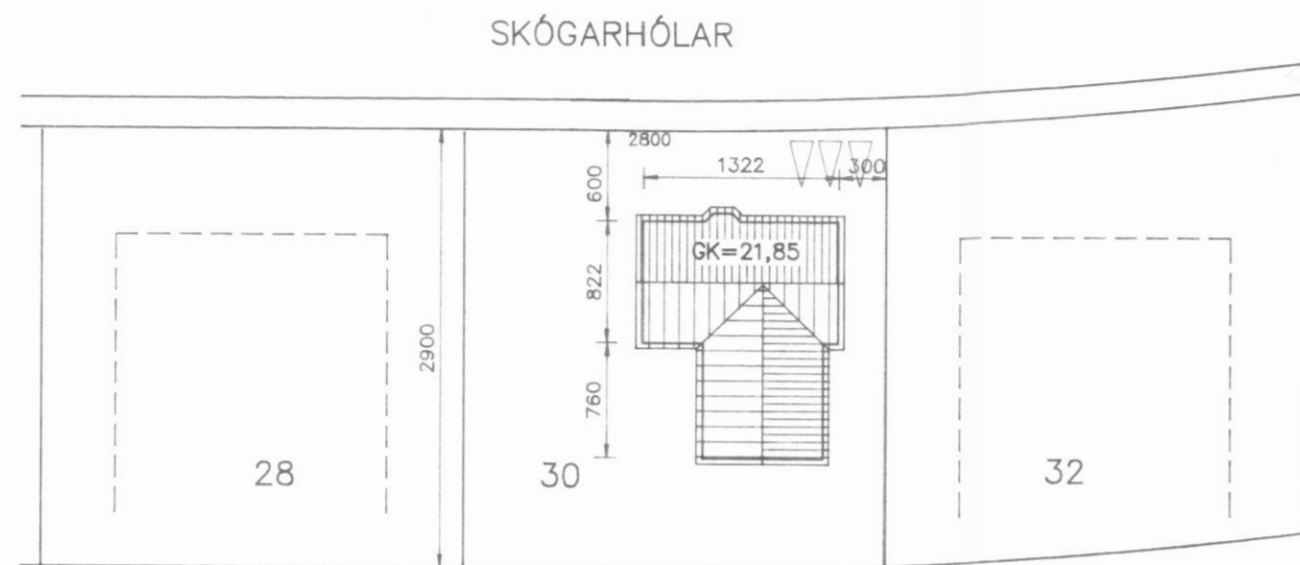
Afstöðumynd mkv. 1:500