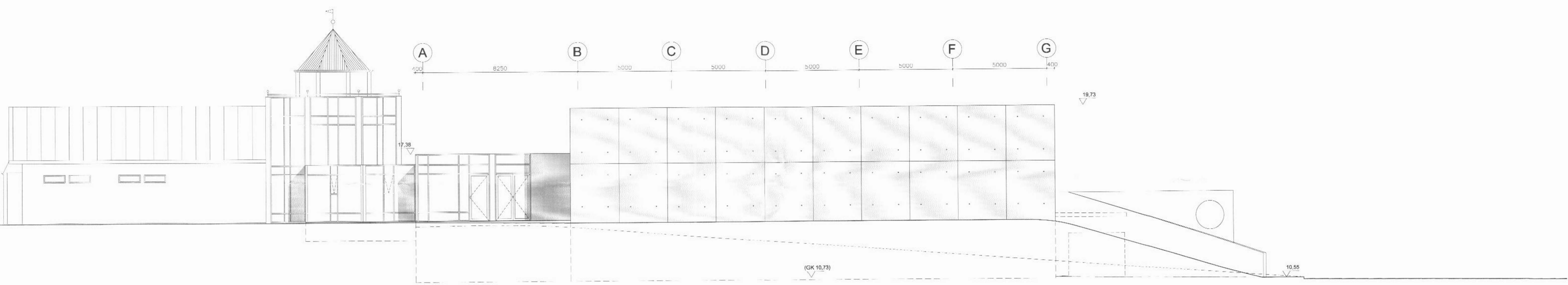
utlit suður m 1:100