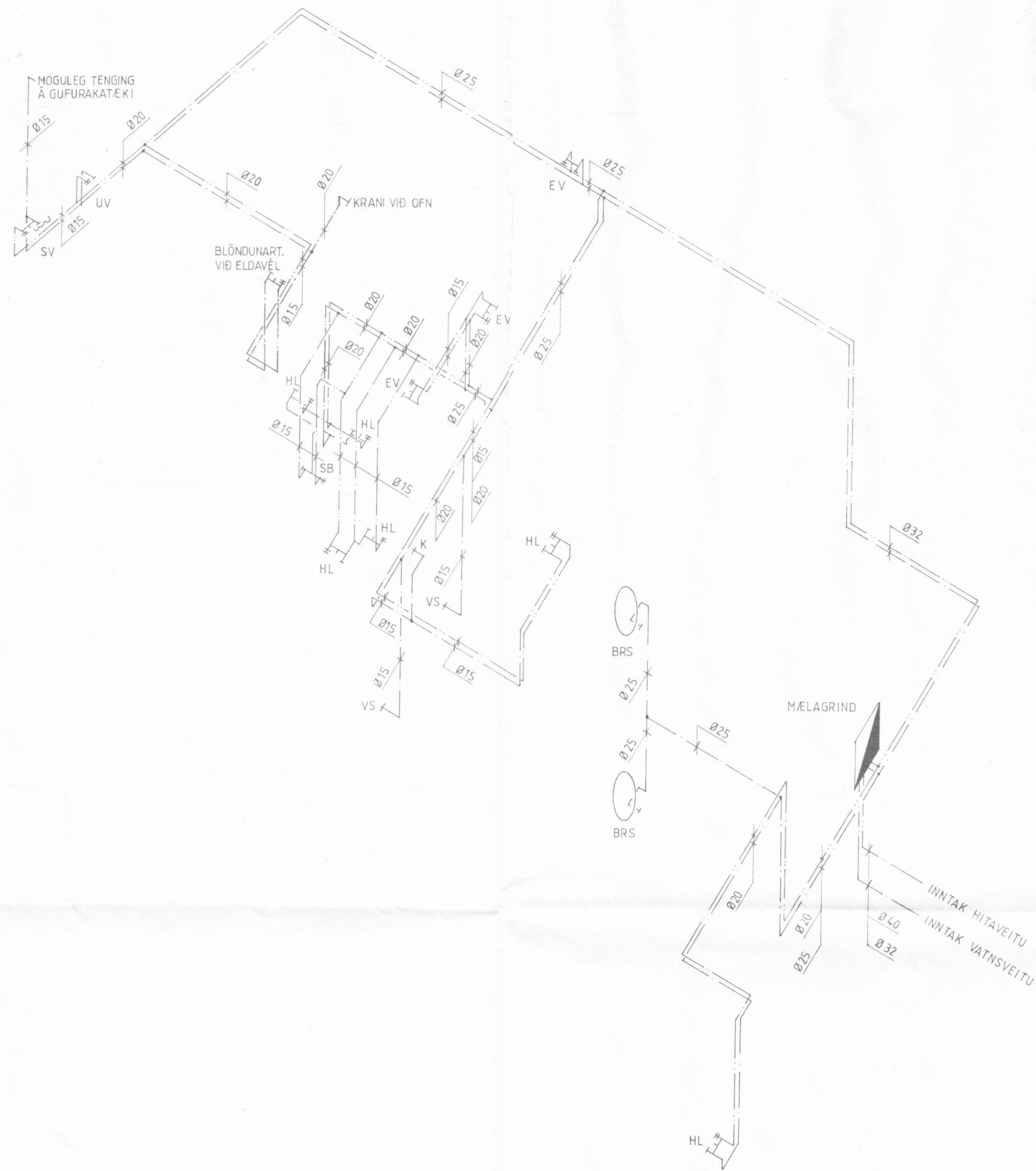
Neysluvatnslögn Mkv. 1:50