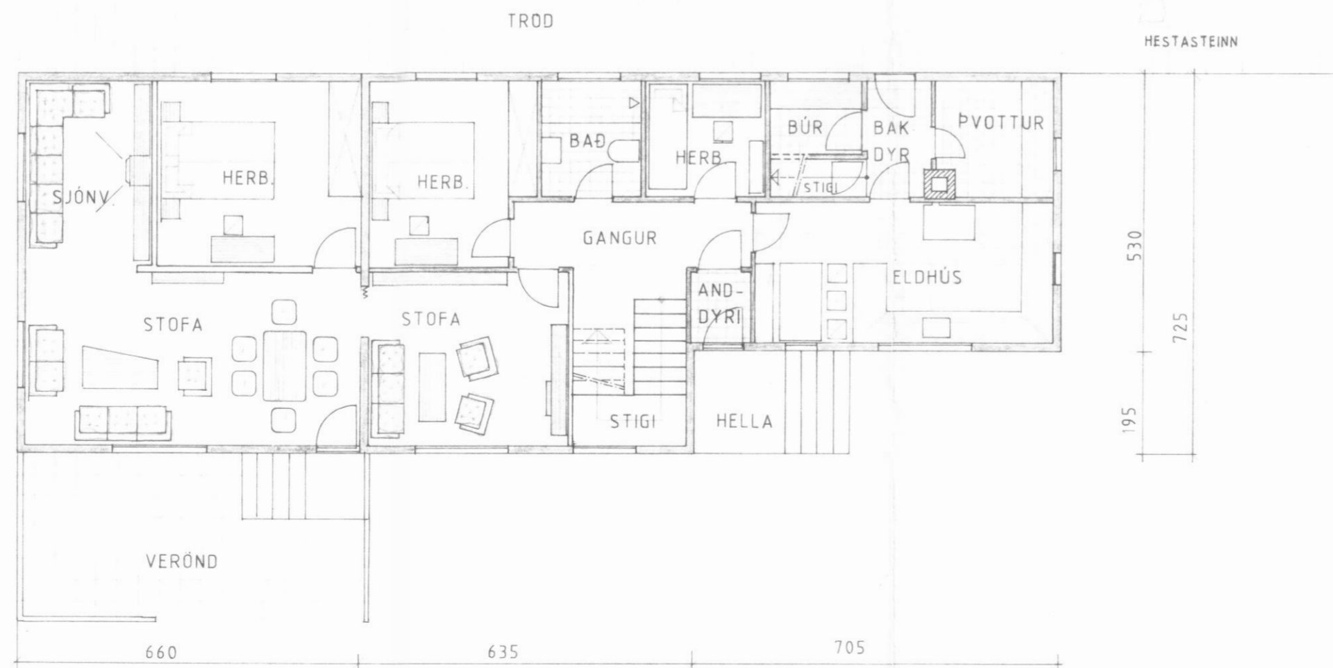
1. HÆÐ GRUNNMYND 1:100