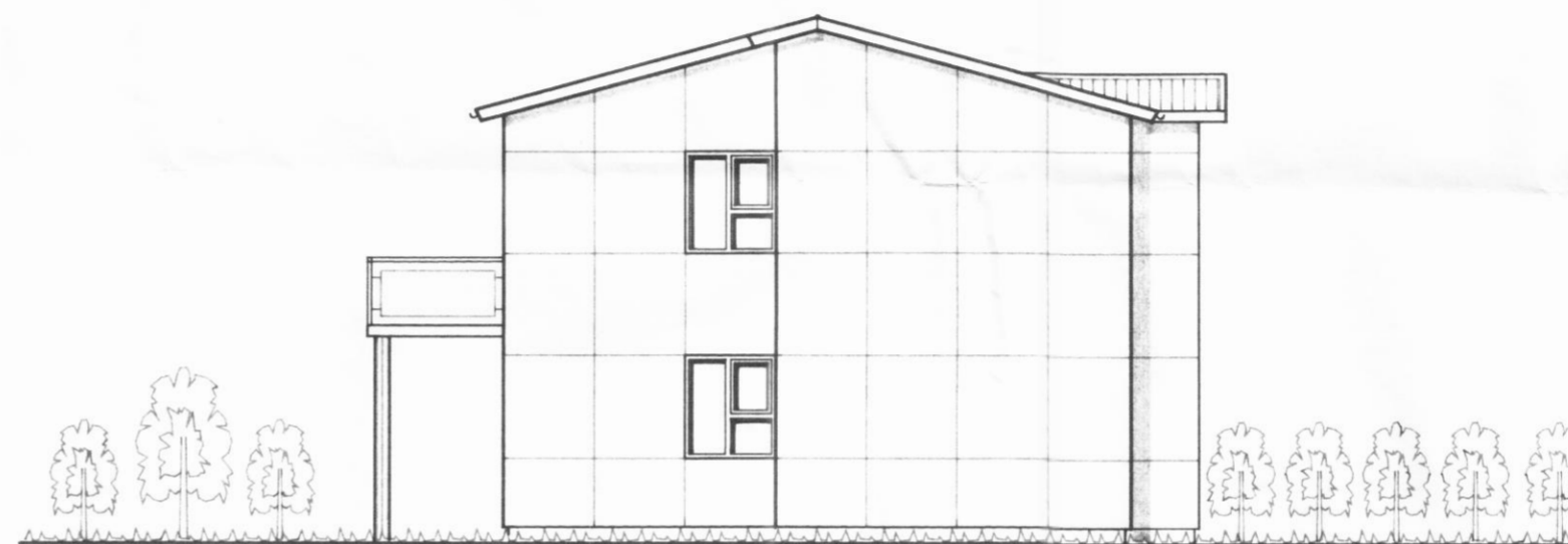
ÚTLIT AUSTUR mkv. 1:100