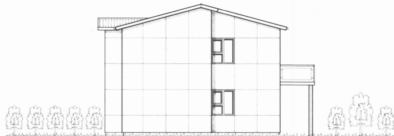
ÚTLIT VESTUR mkv. 1:100