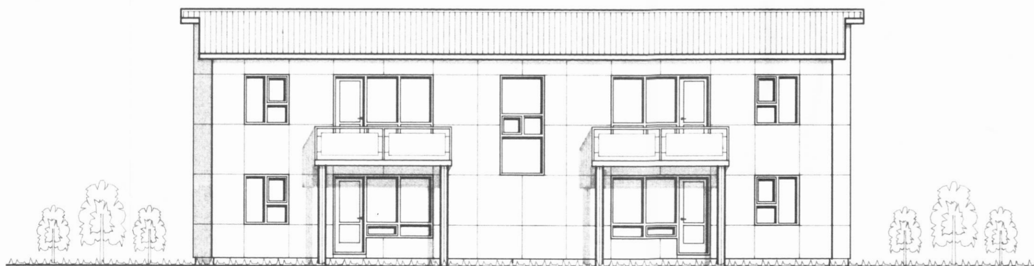
ÚTLIT SUÐUR mkv. 1:100